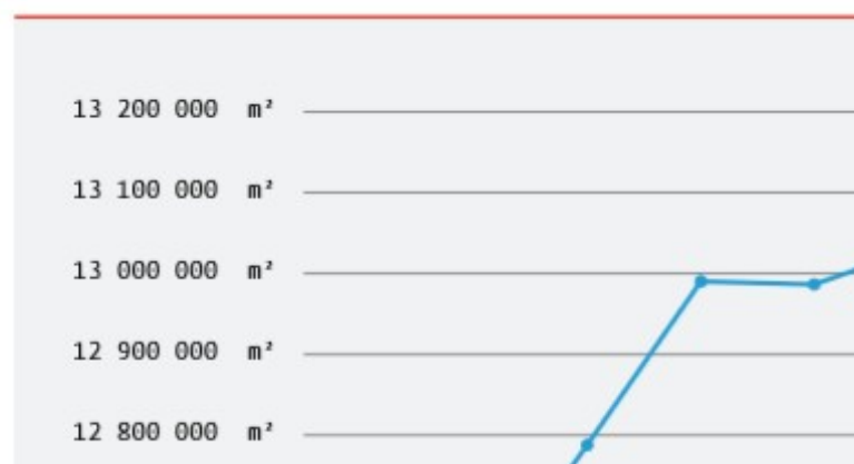
GRAPHIQUE 1 Evolution du stock de bureaux en Région de GRAFIEK 1 Evolutie van het kantorenpark in het Brussels H